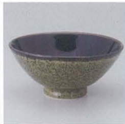
351-402-600 650円 錦天目大茶丼 (15.4×7) 532050160