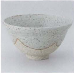
351-101-780 1,550円 晋釉手造り丼 (14.5×14×7.5) 532020378