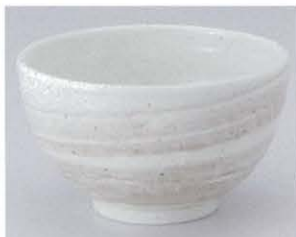
348-403-540 500円 東風石目4.0井 (12.5×7.2) 531860454