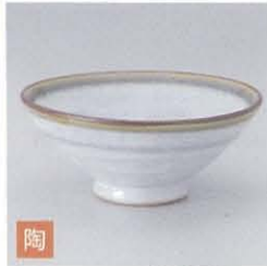
351-203-340 1,150円 測天目ライス丼 (15.5×6.5) 532030334