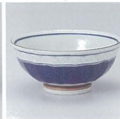
351-604-400 410円 ルリ唐草 お茶漬丼 (14×6.5) 730960440