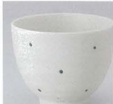
350-201-300 1,150円 呉須丸紋姫井 (10.6×7.7) 1035020130