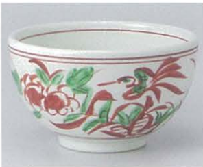
348-103-310 950円 手描花鳥4.0井 (12.5×7) 631740431