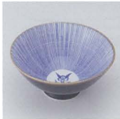
351-301-250 930円 天目十草茶漬 (15.2×6.7) 532040225