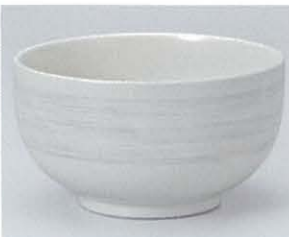
348-601-400 410円 新粉引お好み碗 (13.2×7.3) 730560640