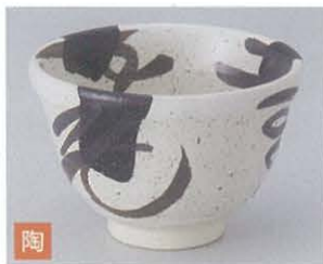
陶 349-303-510 920円 ピカソ茶漬碗 (12×7.8) 532150451