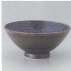
351-302-540 750円 明世黒大茶 (15.3×6.8) 532040354