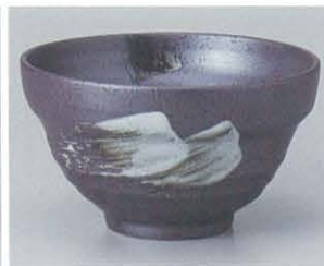
349-604-350 400円 やすらぎ白刷毛小井 (13×7) 631960335