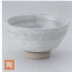
351-206-200 1,300円 ふれあい茶漬碗 (13.3×7.7) 532120620