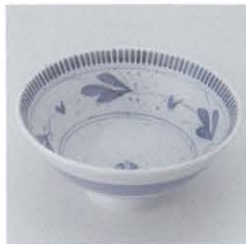
351-401-600 650円 益子つた大茶丼 (15.4×7) 532040660