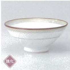
351-201-260 1,500円 乳白のり茶(身) (15.2×6.5) 832510726