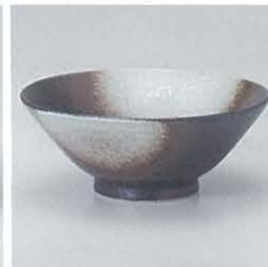
351-507-150 650円 潮騒 4.8ライス丼(15×6) 730950315 351-508-150 600円 潮騒 茶漬丼(φ14×6) 1035150615