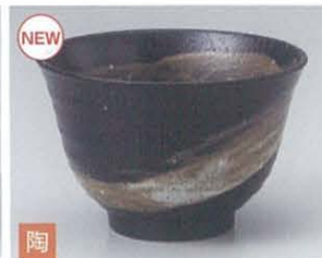
348-604-410 350円 雅風茶漬井 黒 (12.4×8.1) 1034860441