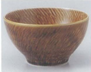
348-202-250 1,230円 かごクラフト鉛13cmボール (12.6×6.9) 934440325