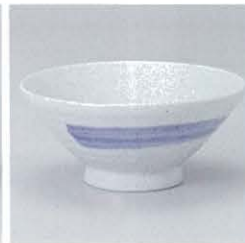
351-602-510 700円 清瀬 4.3茶漬丼 (14×6) 730950551