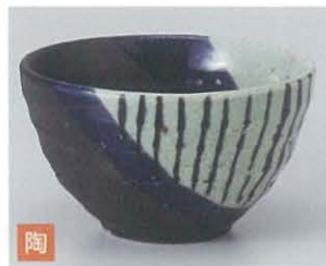
陶 349-301-020 980円 半黒十草お好み碗 (11.7×7) 631940502