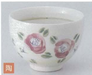
陶 349-103-330 1,550円 椿姫井 (11×8) 531930533