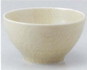
348-203-340 1,250円 ベージュトチリ13cmボール (12×7) 934430434