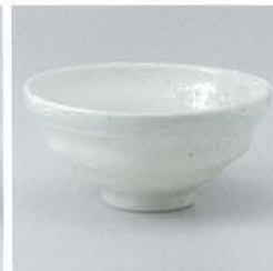
351-504-410 500円 手びねり茶漬け 粉引 (14.8×7) 934760341