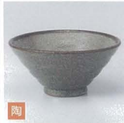
351-204-330 1,150円 唐津 のり茶碗 (15×7) 832520333