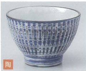
陶 349-104-630 1,300円 化粧削り(紺)12cm井 (12.0×7.9-400cc) 934430363