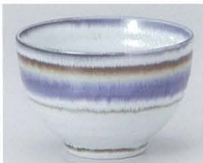
348-303-350 620円 駒筋均窯茶漬井 (12×8.1) 730850235