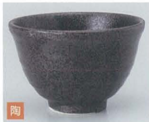
陶 349-404-600 480円 黒天目 小井 (11.8×7.7) 934560260