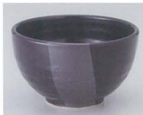
348-404-340 550円 夜宙石目4.0井 (12.5×7.2) 531840434