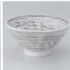
351-405-540 570円 至福(白)5.0丼 (15.2×7.3) 532050454