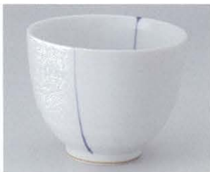
349-203-330 990円 シンプルライン呉須おしゃれ小碗 (10.5×8.2) 532130533