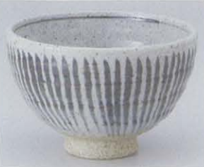
348-201-780 1,850円 細十草雑炊碗 (12.5×8.5) 532110377