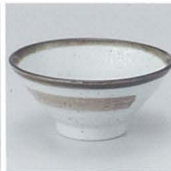
351-403-250 640円 測茶刷毛目茶漬丼 (15.3×6.7) 934760225