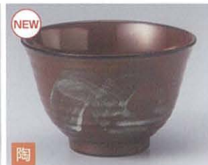
348-602-410 350円 雅風茶漬井 赤 (12.4×8.1) 1034860241