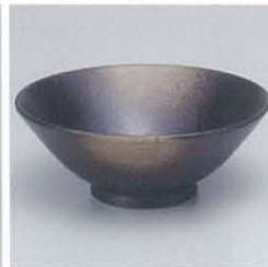
351-406-150 700円 金茶吹 4.8ライス丼(15.3×6) 1035140615 351-407-150 620円 金茶吹 4.2ライス丼(13.5×6) 1035140715