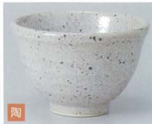
陶 349-405-600 480円 砂丘 小井 (11.8×7.7) 632160360