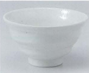
348-501-410 500円 手びねり4.0井 粉引 (13.2×7.5) 934360341