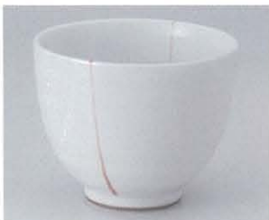
349-204-330 990円 シンプルライン朱おしゃれ小碗 (10.5×8.2) 532130633