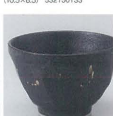
350-301-050 1,200円 白削り夏目茶碗 (11×7) 532130205