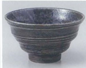
348-502-410 500円 手びねり4.0井 コス釉 (13.2×7.5) 934360541