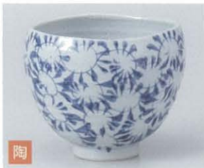
陶 349-102-260 1,750円 手造り唐草たっぶり碗 (約10.4×8.5) 832120226