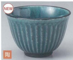
NEW 陶 349-202-630 1,300円 翠(みどり)削ぎ小井 (φ12.0×H8.0) 1034920263