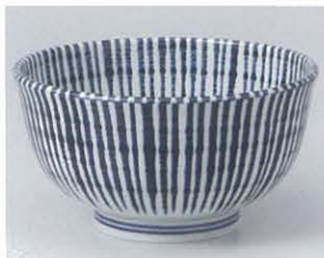
348-302-410 700円 千段十草 4.0多用井 (13×8) 831841041