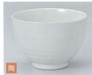
陶 349-601-520 410円 梨地白釉多用井 (12×8.4) 730860552