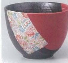
350-101-790 2,600円 粉引 そぎ 姫井 (11×8.2) 832120146