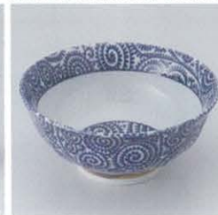
351-605-400 420円 唐草内外お茶漬丼 (14×6.5) 532060240