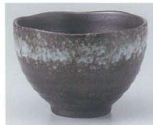
349-501-160 680円 黒吹 茶漬碗 (11.8×7.8) 934540116