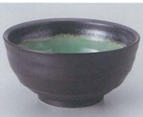
348-401-410 550円 お好み碗 深海GR (13.5×6.5) 934330541