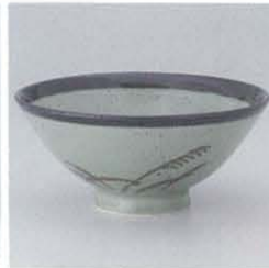
351-306-300 670円 織部スキ大茶身丼 (15.5×7) 532040430