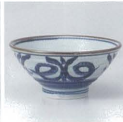
351-305-310 750円 古染唐草飯丼 (14.8×6.7) 832530131