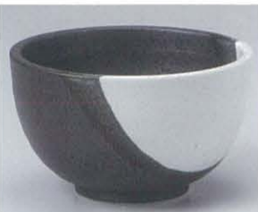
348-301-260 770円 天目塗り分け小井 (φ12.5×7.4) 1034830126