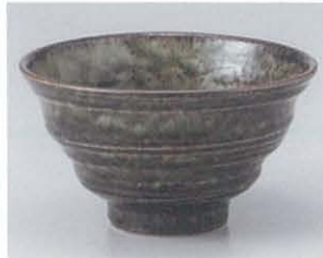
348-503-410 500円 手びねり4.0井 織部 (13.2×7.5) 934360441