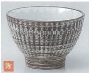
陶 349-105-630 1,300円 化粧削り(茶)12cm井 (12.0×7.9-400cc) 934430263