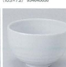
350-501-630 460円 茶漬碗 飯碗 明神 ブチ井 (10.3×7.2) 832360663