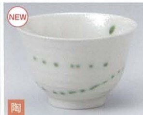
348-603-410 350円 雅風茶漬井 白 (12.4×8.1) 1034860341