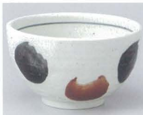
348-304-250 710円 色打ち石目4.0井 (φ12.5×7.5) 832230625