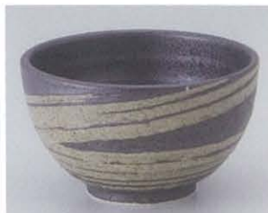
348-402-250 550円 武蔵野4.0井 (12.6×7.2) 531850425