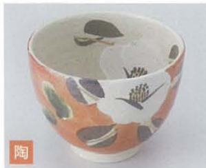
陶 349-101-700 2,380円 赤濃山茶花ミニ井 (11.6×8.7) 531920371