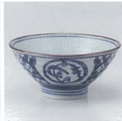
351-304-310 760円 間取稲穂 大茶 (14.8×6.7) 934730231