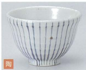
陶 349-304-600 780円 ゴス十草 茶漬碗 (12×8) 730620560