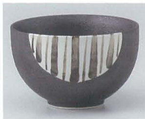
349-302-250 880円 銀彩手描き十草4.0多用井 (11.7×7.3) 934510125