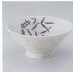
351-502-540 500円 磁器志野大茶 (15.5×7) 532050654