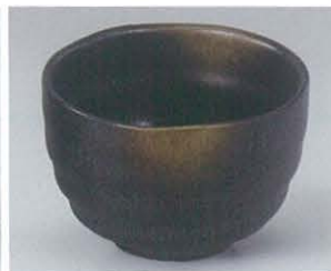
349-503-150 620円 金茶吹京小井 (11×7.4) 742000562