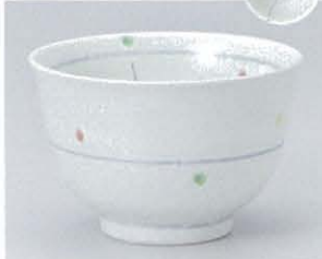
348-204-250 1,000円 三葉水玉4.3寸井 (12.5×8) 730440325