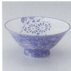
351-501-540 500円 淡雪菊大茶 (15.5×7) 532060154