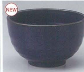
348-505-520 500円 ナマコ 吉祥井(小) (φ12.6×H7.6) 1034850552