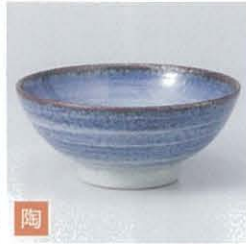
351-106-310 1,150円 ゴス巻丸茶漬丼 (15.5×6.6) 832520231