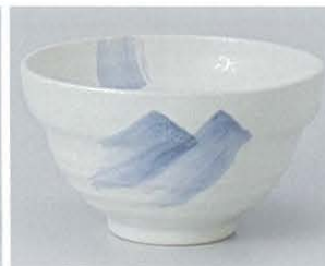
349-603-350 400円 やすらぎ青刷毛小井 (13×7) 631960535