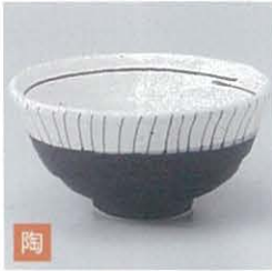
351-102-630 1,350円 白黒ストライプ茶漬碗 (φ14.5×H7) 934710563