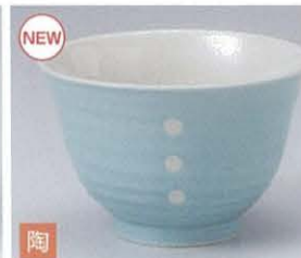
348-605-410 330円 パステルドット茶漬井 スカイブル (12.3×8.1) 1034860541