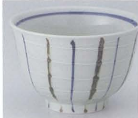
348-205-330 900円 二色トクサ4.3多用井 (12×8) 531660633