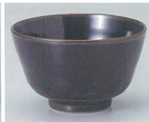
349-605-250 400円 ゆず天目なごみ小井 (11.7×7) 730760225