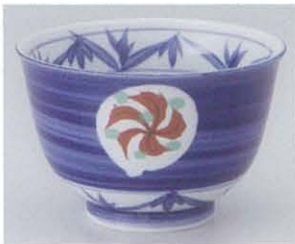
348-104-330 1,100円 赤絵丸紋4.3多用井 (12×8) 531650433