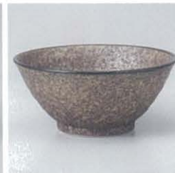
351-505-630 490円 earth4.8めし井(14.5×6.3) 832550663 351-506-630 420円 earth4.2めし井(13×6) 832550763