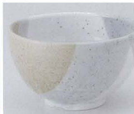
348-305-250 600円 川面4.0井 (12.5×7.2) 531860125