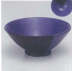
351-202-080 1,280円 響5.0茶漬 (15.5×6.5) 1035120208