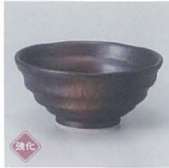
351-107-740 1,600円 火色ろくべ4.3丼 (13.5×6.1) 632010574