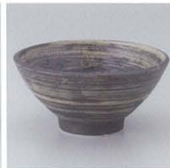
351-404-540 570円 至福(黒)5.0丼 (15.2×7.3) 532050354