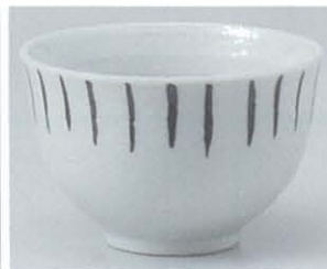
349-502-610 580円 麦わら十草 反茶碗 (11.5×7.2) 934530461