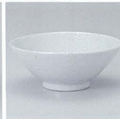
351-606-150 560円 さざ波白4.8ライス丼(15×6) 730950115 351-607-150 520円 さざ波白茶漬丼(14×6) 730950215