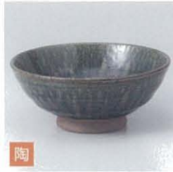
351-105-310 1,150円 紺ビードロ丸茶漬丼 (15.5×6.6) 832520131