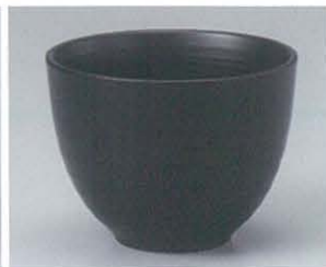
349-505-470 850円 黒マットミニ井 (10.5×8) 1034950547