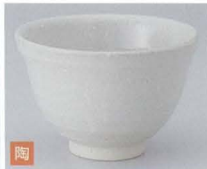
陶 349-403-600 480円 白ボタ小井 (11.7×8) 532160660