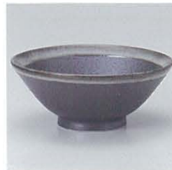
351-601-510 700円 柳ヶ原 4.3茶漬丼 (15.3×6.2) 730940551