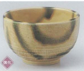
強化 348-101-260 2,000円 黄交趾4.0多用井 (12.7×7.5) 934420126