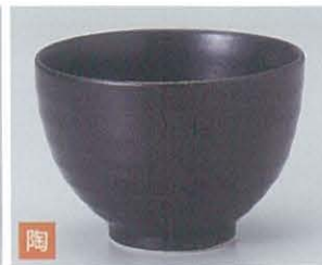
陶 349-602-520 410円 梨地天目多用井 (12×8.4) 730860552