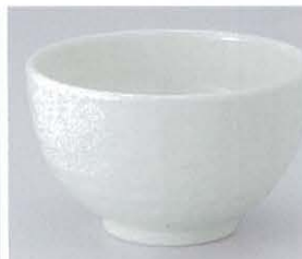
348-405-310 640円 クリーム結晶石目4.0井 (12.5×7.2) 531840531