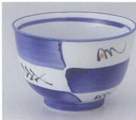
348-105-310 830円 間取イゲタ4.3多用井 (12.5×8) 531660331