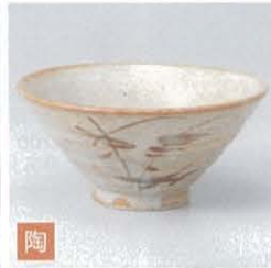
351-205-330 1,100円 志野スキ のり茶碗 (15×7) 832520433