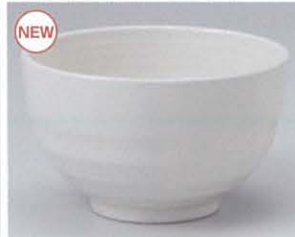
348-504-520 470円 白釉 吉祥井(小) (φ12.6×H7.6) 1034850452