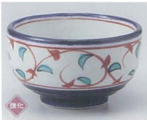
強化 348-102-260 2,600円 手描き唐草4.0多用碗 (12×7.4) 934410126