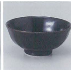
351-603-510 500円 ゆず天目茶漬丼 (14×6.2) 632050351