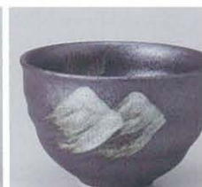
350-601-400 630円 佐賀錦 4.5京碗 (12.8×6.2) 730730640