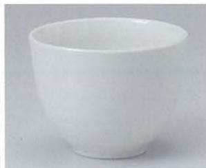
349-504-470 850円 白マットミニ井 (10.5×8) 1034950447