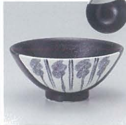
351-303-330 700円 黒しぐれ 大茶碗 (15.3×6.8) 730930633