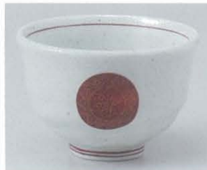
349-402-020 950円 ゴールド三ツ紋なぶり小井 (12×7.9) 934450302