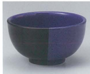
349-401-080 1,200円 響3.8多用井 (12×6.5) 1034940108