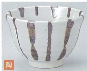
陶 349-305-600 780円 サビ十草 茶漬碗 (12×8) 730620660