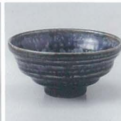
351-503-410 500円 手びねり茶漬け ゴス釉 (14.8×7) 934760441