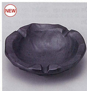
NEW 430-204-511 850円 いぶし黒 灰皿 (11.9×11.6×3.2) 1143020451