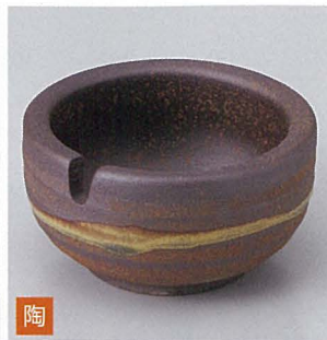
430-105-251 800円 備前灰皿(小) (8×4.3) 540720225