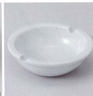
430-505-151 350円 白玉洲丸灰皿 (10×3.3) 540750715