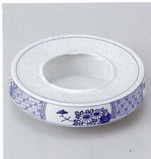
430-101-791 2,200円 四君子6.0灰皿 (18×5) 540430177