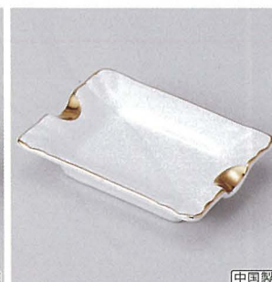
中国製 430-502-631 760円 レイノー 長角灰皿(白) (9.2×7×2.1) 540760363