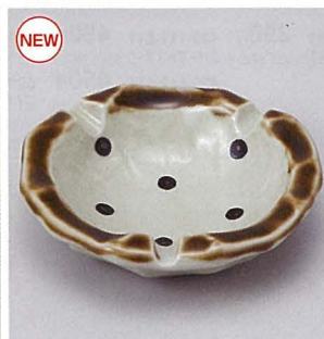
NEW 430-202-511 850円 アメ点 灰皿 (11.9×11.6×3.2) 1143020251