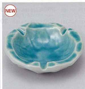
NEW 430-205-511 850円 トルコ貫入 灰皿 (11.9×11.6×3.2) 1143020551