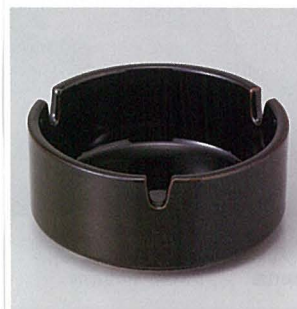
430-401-201 570円 天目三ツ切灰皿 (10.2×4.5) 540740120