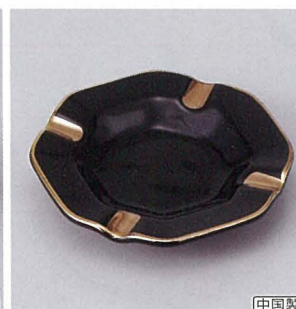
中国製 430-503-631 860円 レイノー 八角灰皿(黒) (9×2) 540760663