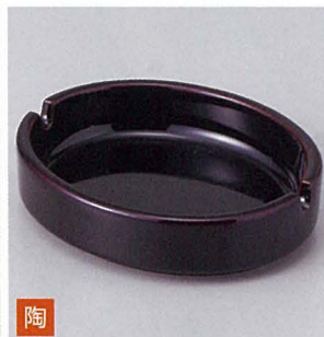
陶 430-303-471 420円 天目楕円灰皿 (10.5×9×2.6) 540740647