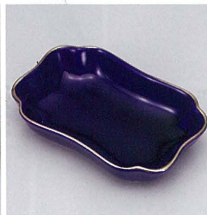
430-304-031 780円 金線ルリフリートレー (10.4×6.9×2.3) 1043960503