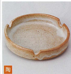
陶 430-301-341 780円 志野三ツ切灰皿 (12×2.8) 540660534