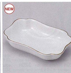
NEW 430-404-031 680円 金線NBフリートレー (10.4×6.9×2.3) 1143040403