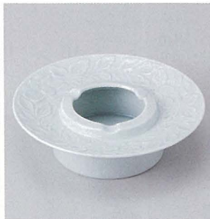
430-102-791 1,900円 青磁唐草6.0灰皿 (18.5×5.5) 540430477