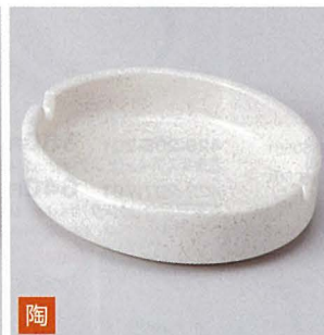
陶 430-302-471 420円 梨地楕円灰皿 (10.5×9×2.6) 840320547