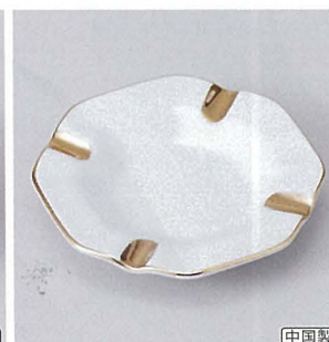
中国製 430-504-631 760円 レイノー 八角灰皿(白) (9×2) 540760563