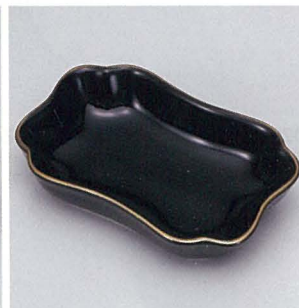
430-305-031 780円 金線ブラックフリートレー (10.4×6.9×2.3) 1043950503