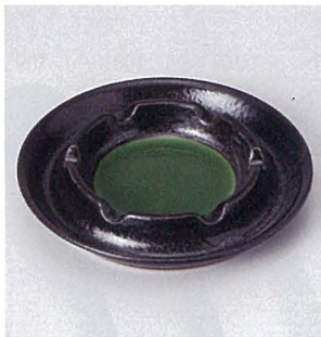
430-103-251 550円 フジ型ミドリ4.0灰皿 (13.2×2.5) 1043810325