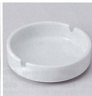
430-403-151 330円 白丸4吋灰皿 (10.5×3) 540750615