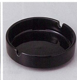
430-402-151 380円 黒丸4吋灰皿 (10.5×3) 540750515