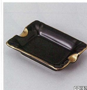
中国製 430-501-631 860円 レイノー 長角灰皿(黒) (9.2×7×2.1) 540760463