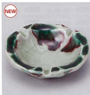
NEW 430-203-511 850円 辰砂織部 灰皿 (11.9×11.6×3.2) 1143020351