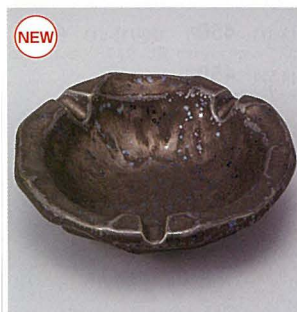
NEW 430-201-511 850円 金結晶 灰皿 (11.9×11.6×3.2) 1143020151