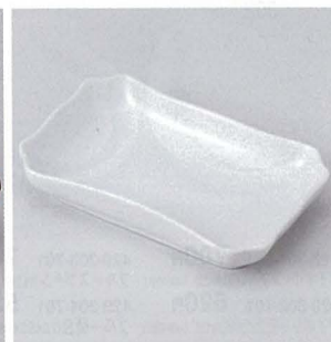
430-405-031 600円 白長角ジャスト (11.6×7.8×2.3) 943550403