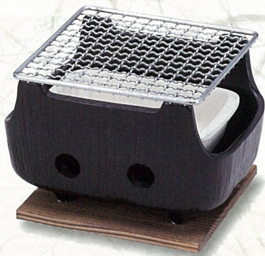
725-207-841 8,000円 志野7.0水コンロ(木台・網付)(19×8.8) 868620484 725-208-841 1,600円 7.0ゴトク(19.6×6.2) 565220684 725-209-841 2,000円 7.0水コンロ用アミ(19) 565220684