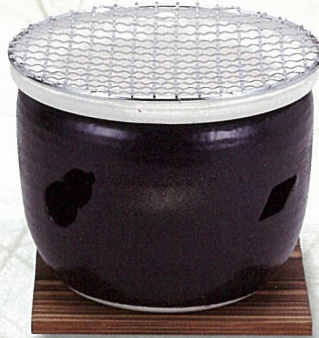
725-107-841 12,500円 志野10.0水コンロ(木台・網付)(29.5×11.5) 868620184 725-108-841 3,800円 10.0ゴトク(29.5×8.5) 565220884 725-109-841 2,500円 10.0水コンロ用アミ(29) 565220984