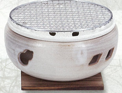
725-201-821 5,000円 灰袖ミニコンロ(木台・網付)(16.8×11.8) 565230182 725-202-821 1,500円 5.0ゴトク(19.6×6.2) 565230582 725-203-821 1,800円 5.0金網17cm 565230382