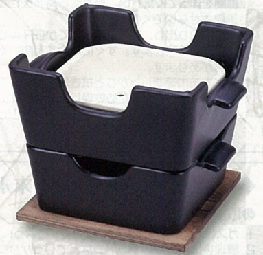
725-401-841 4,000円 火消しつば(木台付)(17×13×5) 565330182