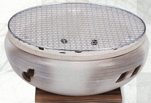
725-101-841 11,000円 灰袖手付9.0水コンロ(木台・網付)(32×27×11) 565240184 725-102-841 3,200円 9.0ゴトク(26.5×8) 565240284 725-103-841 2,200円 9.0水コンロ用アミ(26) 565240384